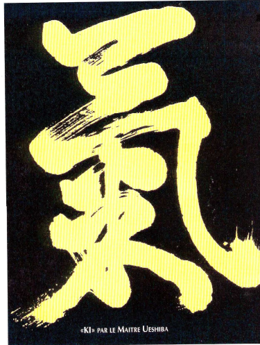
« Ki » par Maître Ueshiba

Certains osent affirmer que la plupart de nos maux ont pour origine la perte de contact avec notre « hara ».